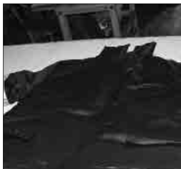
Արտադրության գործընթացում 20-25 մարդ է ընդգրկված: Թողարկվող արտադրանքի տեսականիս է՝ բանվորական արտահագուստներ, սավաններ, ձեռնոցներ, խալաթներ, քսակներ (հանքաքարի նմուշների համար, «Գինո գոլդ մայնինգ քամփին» ՓԲ ընկերության պարվերն է), մի խոսքով՝ այն ամենը, ինչ կապված է կարելու պրոցեսի հետ:

Լրանում է 30 տարին, ինչ գործում է «Հայաստանի կույրերի միավորման Կապանի ուսումնարարական ձեռնարկություն» սահմանափակ պատասխանատվությամբ ընկերությունը, մասնագիտացված մի ձեռնարկություն, որն ի սկզբանե մարդասիրական առաքելություն ուներ՝ հանրագուտ աշխատանքում ներգրավել տեսողությունից տարբեր կարգի հաշմանդամ մարդկանց: Կլոր տարեթիվն առիթ է փոքր-ինչ հետադարձ հայացք ձգելու նրա անցած ուղուն: Հիմնադրման տարում ձեռնարկությունն արտադրում էր մեկ-երկու արտադրատեսակ՝ ճոճացանցեր, որոնց առաջնան աշխարհագրությունը շատ ավելի ընդգրկում էր՝ հորհրդային Միության 30-ից ավելի քաղաք, բանվորական ձեռնոցներ, միայն Ռոստովի մարզի գյուղատնտեսության համար՝ ամսական 34 հազար զույգ ձեռնոց էին կարում: Այնուհետև ձեռնարկությունը տարեցտարի բարձրացրեց տեսականիմ դրա թիվը հասցնելով տասը-տասներկուսի: