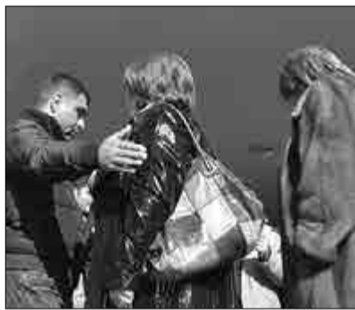
Մանուկյանի Լուսանկարը՝ Ա. Նավասարդյանի

Սյունիքի մարզկենտրոնի գլխավոր հրապարակը լեփ-լեցուն էր կապանցիներով: Նրանք հավաքվել էին դիմավորելու Բաֆֆի Հովհաննիսյանին, ով օրվա առաջին կեսին հասցրել էր (իր իսկ ձեւակերպմամբ) քաղաքացիների հետ հանդիպումներ ունենալ Ազարակ, Մեղրի, Քաջարան քաղաքներում: Ներկաներն աղուհացով եւ օվացիայով դիմավորեցին «ժառանգության» առաջնորդին: Բաֆֆի Հովհաննիսյանին ընդհատելու փորձերն արժանացան հավաքված-