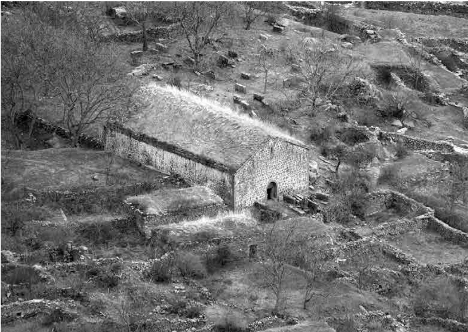
Հին Յայջի գյուղի կենտրոնը, որպեսզի գտնվել է Ա. Բակունցի նկարագրած դպրոցը

Կատաղի գեղեցիկները հաչոցով են դիմավորում մեզ: Մի հսկայամարմին տղա սիրով հանձն է ամուսն մեզ մինչև գյուղխորհուրդ ուղեկցել: Համեմատաբար ընդարձակ մի բակում զվարթ ու աղմկոտ խաղում են երեխաները: - Մեր դպրոցն է, - ասում է մեր ուղեկցորդը: Ձանգը հնչեց, եւ երեխաները դասամիջոցից հետո սկսեցին հավաքվել դասարան: Չիս տղային տալով՝ եւ մտա դպրոց: Դպրոցի շենքը ոչնչով չի տարբերվում սովորական գյուղական խրճիթից: Միայն պատերն ավելի սպիտակ են թե՛ դրսից, թե՛ ներսից: Երկաթե ճաղերով երկու փոքրիկ պատուհանը Նիկոլայի ժամանակվա նախնական կալանքի բանտախուց են հիշեցնում: Ուսուցիչը՝ մի քիչ կորամեջք, հոգնաբեկ, տեսքից ֆլեգմատիկ, մոտեցավ, բարեկեց ու սիրով թույլ տվեց դասը լսել: Դպրոցը տեղավորված էր մի սենյակում: Ուսուցիչը պարապում էր առավոտից իրիկուն, նախ մեկ, հետո մյուս խմբի հետ, իսկ երեկոյան լիկալանում: Չներկած, բավական կոպիտ նստարաններին մոտ քառասուն հոգի էր նստած: Պատերը մերկ են, քարտեզ չկա, եթե չհաշվենք պետապի կեղտոտված պլակատը: Աճյունում մեծ վառարան: Աթար են վառում, եւ դրանից դասարանում խեղդող, ծանր հոտ է: Աշակերտները հերթով մի քիչ աթար են բերում, օրվա վառելիքը: Հայոց լեզվի դաս էր: Իմ ներկայությունը շեղում էր աշակերտների ուշադրությունը, եւ նրանց հետաքրքրասեր այքերը շուտ-շուտ ինձ էին նայում: Նրանք իրար մեջ քչփչում էին: